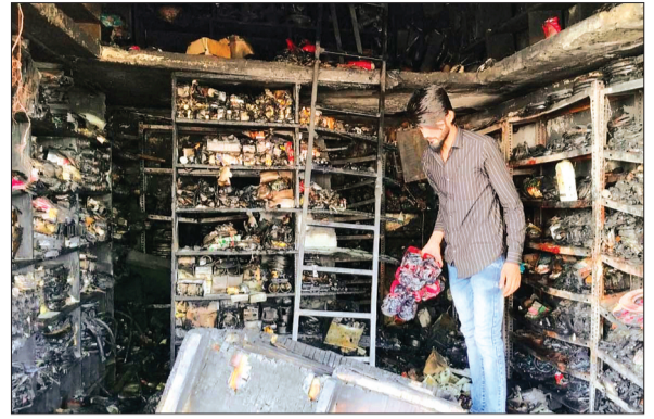
आष्टा। पार्ट्स की दुकान में बीती रात्रि में लगी आग से जलकर राख हुआ सामान।